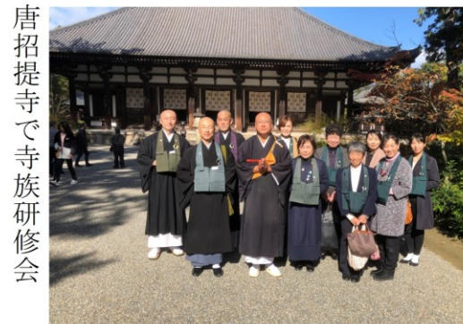
唐招提寺で寺族研修会